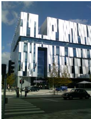
Uppsala Konsert & Kongress