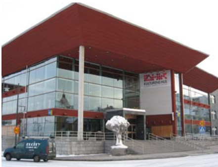
Kulturens hus i Luleå

En fördjupad fallstudie av Kulturens hus i Luleå och jämförande studier av andra kulturhus, det vill säga offentliga byggnader för kulturella aktiviteter: Kulturhuset Vingen, Vara Konserthus, Uppsala Konsert & Kongress och Mimerns Hus, byggda i Sverige under 2000-talet har legat till grund för utvecklingen av analysmetoden.